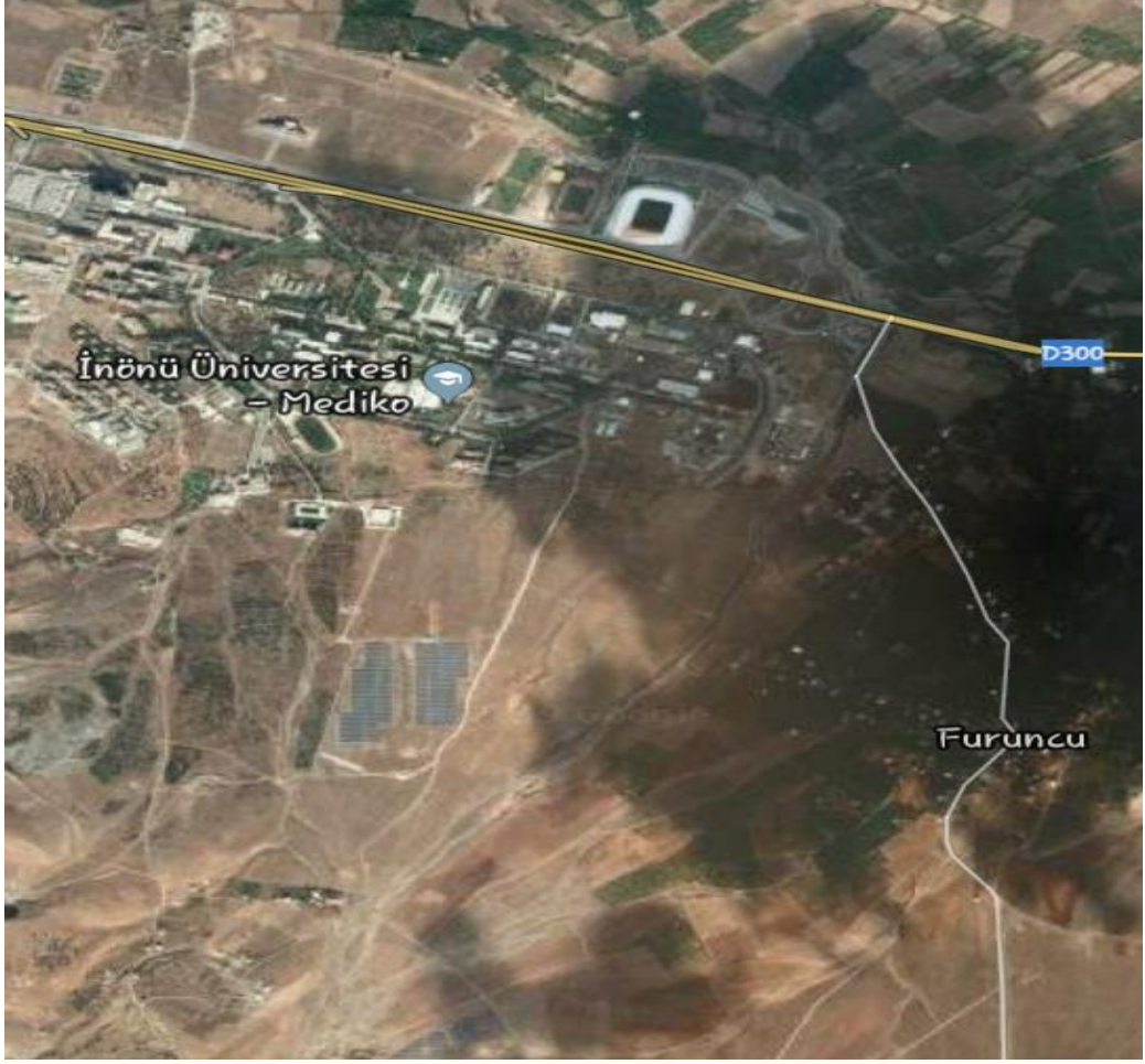
Harita. 2: İnönü Üniversitesi ve Fırıncı Köyü Uydu Görüntüsü