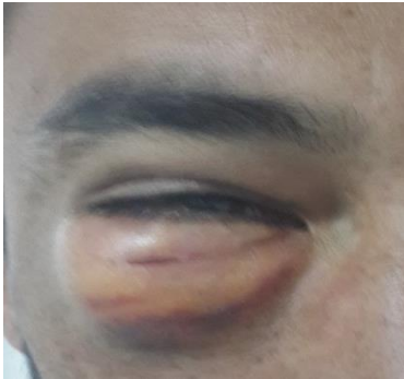
Resim 1: Hastanın sağ alt göz kapağında şişlik olduğu ve palpasyonda ciltte krepatasyon alındığı görüldü.

Otuz iki yaşındaki erkek hasta, hapşırma esnasında ağzını kapattığı için sağ göz alt kapağında belirgin bir şişlik ve ağrı şikâyetiyle acil servise başvurdu. Hastanın daha öncesinde sinüzit, geçirilmiş travma veya cerrahi öyküsü yoktu. Muayenesinde, sağ gözde görme alanını azaltan ve palpasyonla krepatasyon veren şiddetli amfizematöz kapak şişliği vardı. (Resim 1) Hasta göz hastalıkları doktoruna konsülte edildi, sonrasında ileri tetkik, tedavi ve takip amaçlı göz hastalıkları servisine yatırıldı. Hastanın alt göz kapağındaki şişlik, görme alanını azalttığı için insülin enjektörü ucuyla çeşitli bölgelerden bu hava boşaltıldı. Havanın çıkmasıyla birlikte hastanın kliniğinde ciddi bir düzelme olduğu görüldü.