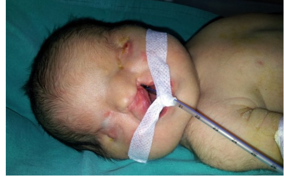
Resim 1. Olgunun yüz görünümü. Bilateral kriptoftalmus, hipertelorizm, basık burun, yarık dudak, kısa boyun görülmektedir.

parmakları arasında kutanöz sindaktili) ve umbilikal herni fizik muayenede dikkati çeken diğer bulguları (Resim 2).