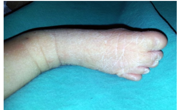
Resim 2. Olgunun 2. ve 3. ayak parmaklarındaki sindaktili görülmektedir.