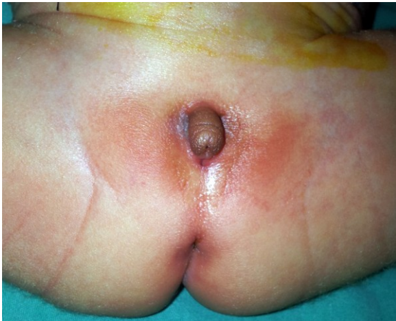
Resim 3. Olgudaki ambigus genitalya görünümü

Fraser Sendromunun tanı kriterlerinden 2 major yanında 1 minör veya 1 major yanında en az 4 minör kriter varlığı tanı için gerekmektedir (2). Hastamızda 3 major (bilateral kriptoftalmus, sindaktili, kuşku genitalya) ve 6 minor anomali (kulak, burun anomali, renal agenezi, laringeal anomali, yarı damak ve dudak, umbilikal herni) saptanarak Fraser sendromu tanısı kondu.