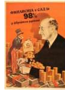
Resim 7. "ABD" Konulu Propaganda Posterleri

Yananlam bağlamında incelendiğinde, posterde Sam Amca'nın ABD'nin simgesi, Yahudi bankerin ise tüm Yahudilerin metonimi olarak ön plana çıkarıldığı görülmektedir. Naziler, Yahudi oluşturduğunu iddia ettikleri tehdidin ortadan kaldırılmasını amaçlamaktaydı (Warburg, 2010, s. 5). Antisemitizm, Yahudileri ekonominin dışında tutma sürecini de beraberinde getirmekteydi (Safrian, 2000, s. 390). Bu propaganda posterinde de Yahudilerin ekonomik anlamda oluşturduğu sözde tehdide vurgu yapılmaktadır. Böylece ABD'de bulunan zenginliklerin Yahudiler tarafından ele geçirildiği ve ABD'nin ekonomik gelirlerinin Yahudilere yönetildiği aktarılmaktadır. Posterde, çalışma kapsamında incelenen diğer posterlerin aksine sayısal veriden yararlanılmıştır. Buna karşın %98'lik oran, posterde herhangi bir kaynağa dayandırılmamıştır. Naziler, dünyanın en güçlü ekonomilerinden biri olan ABD ekonomisinin doğrudan Yahudilerin elinde bulunduğunu iddia etmesi ile ABD'de nüfus olarak sınırlı bir orana sahip olan Yahudi halkının, ülkedeki genel ekonomik yapıda ne kadar etkili olabildiğini aktarmaktadır. Yahudiler posterde "sömürü" metaforu olarak sunulmakta ve bu yolla Nazi propagandası "Yahudiler, ABD ekonomisini elinde tutmaktadır" şeklindeki miti inşa etmektedir. İnşa edilen propaganda miti ile Yahudilerin benzer bir etkiyi Sırbistan'da da oluşturabileceği belirtilmektedir. Bu süreçte Sırp ların,