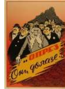
Resim 5. "Tehdit" Konulu Propaganda Posteri

Yahudilerin sayısının artması, Sırp halkı üzerinde kurdukları tahakkümün daha da güçleneceği algısını oluşturmaktadır. Bu da Sırp halkını, Yahudilerin sayısının artmasını engellemeye yöneltmektedir. Naziler Yahudileri "egemenlik" metaforu olarak aktarmakta ve böylece posterde "Yahudiler, Sırbistan'a egemen olmaktadır" propaganda miti inşa edilmektedir. İnşa edilen propaganda miti ile birlikte Yahudilerin, Sırbistan'ı ekonomik ve sosyal manada ele geçirecekleri mesajı verilmektedir. Nazi propagandası, posterde kullandığı yazılı koda "Onlar" şeklinde Yahudileri nitelendirmektedir. Böylece Naziler, Yahudilerin Sırbistan'ın bir parçası olmadığını aktarmakta, Sırları ve Yahudileri ayrı ayrı gruplar olarak değerlendirmektedir. Naziler, Yahudileri ötekileştiren ve dışlayan bir dil kullanarak, Sırların Yahudileri kendilerinden farklı ve tehlikeli bir grup olarak algılamalarını istemektedir. Nazilere göre Yahudilerin Sırbistan'da sayılarının artması, Sırlar için tehlikenin bir habercisi olarak sunulmaktadır. Böylece Sırların kendi