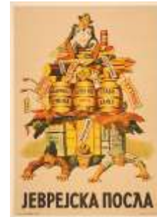
Resim 1. "Alışveriş" Konulu Propaganda Posterleri

"Alışveriş" konulu propaganda posterleri düzenlem boyutunda ele alındığında, posterde Yahudi bir bankerin Sırbistan'da bulunan temel ihtiyaç ürünlerinin üzerinde oturduğu görülmektedir. Kişinin Yahudi olduğu, üzerinden bulunan altıgen yıldızdan ve yüzündeki görsel kodlardan anlaşılmaktadır. Nazi propaganda çizimlerinde Yahudiler, genelde iri burunlu, sivri kulaklı ve geniş dudaklı olarak temsil edilmektedir. İhtiyaç ürünlerinin hemen altında da görsel kodlar içerisinde farklı sosyo-ekonomik sınıftan Sırp vatandaşlarının ezilmekte olduğu yansıtılmaktadır. Posterde Yahudi banker keyifli olarak belirtilirken, Sırp vatandaşları ise acı çekerken aktarılmaktadır. Posterin altında ise "Yahudi Alışverişi" yazılı kodu bulunmaktadır.