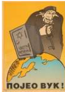
Resim 6. "Servet" Konulu Propaganda Posterleri

Poster yananlam açısından yorumlandığında, posterde Yahudilerin dünyanın ekonomik zenginliklerini sömürdükleri mesajının verildiği görülmektedir. Nitekim Yahudilerin, kriz döneminde ekonomik olarak iyi durumda olmaları, Yahudilere karşı olumsuz bir tutuma yol açabilmekteydi (Kohl, 2011, s. 8). Posterde resmedilen kasa görseli, sözde Yahudilerin dünya zenginliklerini sömürerek elde ettiği servetin simgesi olarak kullanılmaktadır. Böylece "Yahudiler, dünya ekonomisini elinde tutmaktadır" şeklinde propaganda miti inşa edilmektedir. Nitekim kasanın üzerinde bulunan altıgen yıldızda posterde verilen mesajı güçlendirmektedir. Posterde Yahudi'nin elinde bulunan anahtar görseli de Yahudilerin dünyadaki servetin idaresini ellerinde tuttıklarını simgelemektedir. Böylece Yahudiler, posterde "sömürü" metaforu olarak ön plana çıkarılmaktadır. Kasanın hemen yanında bulunan Yahudi'nin korkutucu resmedilmesi ile Sırp halkının Yahudilere yönelik ön yargı geliştirmesi amaçlanmaktadır. Naziler, Sırp lar ile birlikte dünya milletlerinin yaşadığı ekonomik sıkıntılarının temeli olarak Yahudileri göstermektedir. Nazi propagandası, Yahudilerin dünya halklarının emeklerini sömürerek zengin olduklarını ve halen zenginliklerin önemli bir bölümünü ellerinde bulduklarını aktarmaktadır. Böylece Naziler, ekonomik nedenlerden dolayı Sırp ların, Yahudilere karşı olumsuz bir algı geliştirmesini istemektedir.